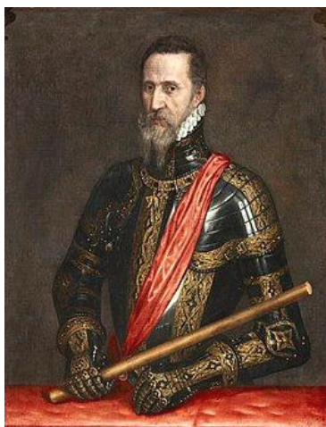
Antoon Lalaing, graaf van Hoogstraten

Ook tijdens de beeldenstorm in 1566 leed de priorij van Leliëndael veel schade. Een bende beeldstormers "van meer dan honderd personen", viel het klooster binnen en sloeg alles kort en klein in de kloosterkerk. De nonnen vluchtten naar hun refugium op de Ganzendries te Mechelen. Op bevel van landvoogdes Margaretha van Parma die toen resideerde in Mechelen, werd een groep edellieden onder leiding van de graaf van Hoogstraten, Antoon van Lalaing, toenmalig gouverneur naar Leliëndael gestuurd om de beeldstormers te verdrijven. De aangerichte schade was enorm.