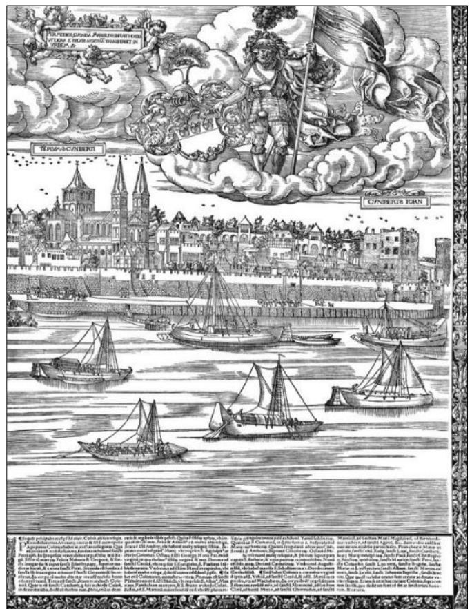
Houtgravure van Anson Woensam "Ansicht von Köln 1531" met links de Sankt-Kunibertskirche waar de zusters in Keulen een woning huurden .