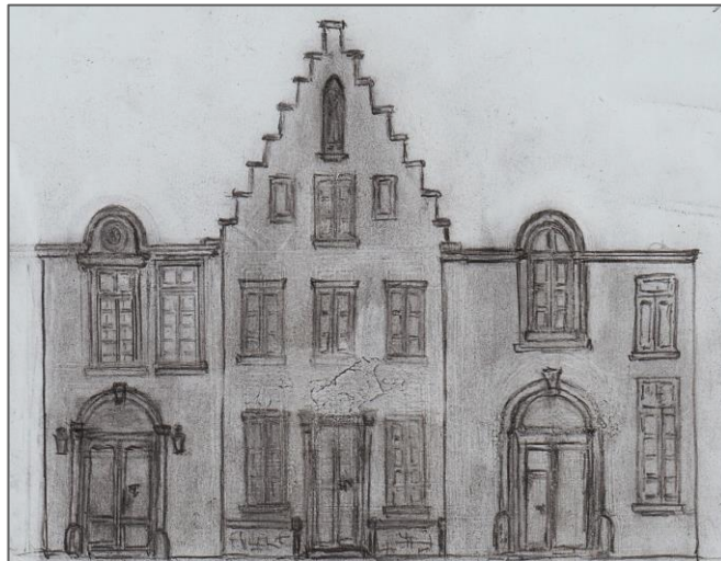
Reconstructie potloodtekening door Herman Van Lint