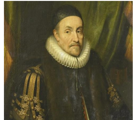
Fernando Alvarez de Toledo Spaanse generaal en landvoogd van de zuidelijke gewesten