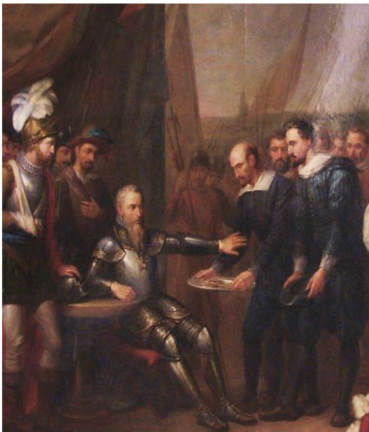
Overgave van de stad Mechelen aan de hertog van Alba"

Op 29 augustus 1572 opende Mechelen de poorten voor de Geuzen, die namens Willem van Oranje de stad kwamen bezetten. Willem van Oranje zelf arriveerde daar op 18 september. Hij plaatste een klein garnizoen