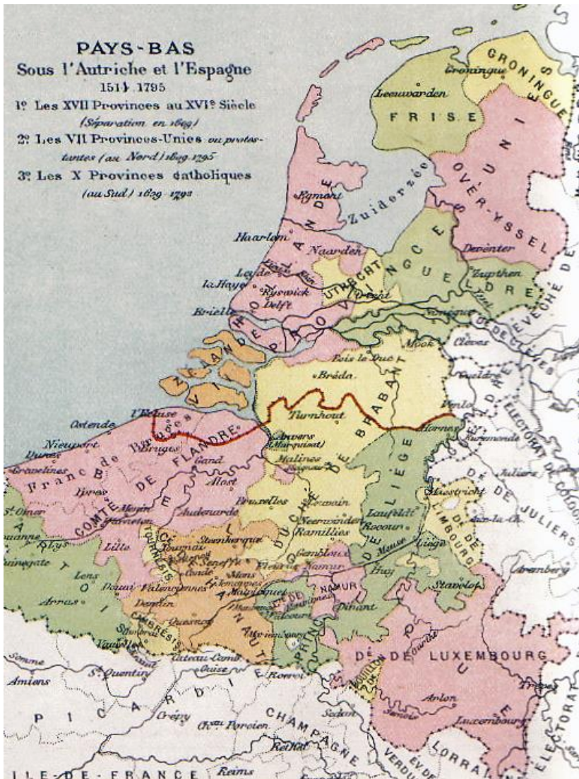
Willem van Oranje-Nassau Republiek Verenigde Nederlanden