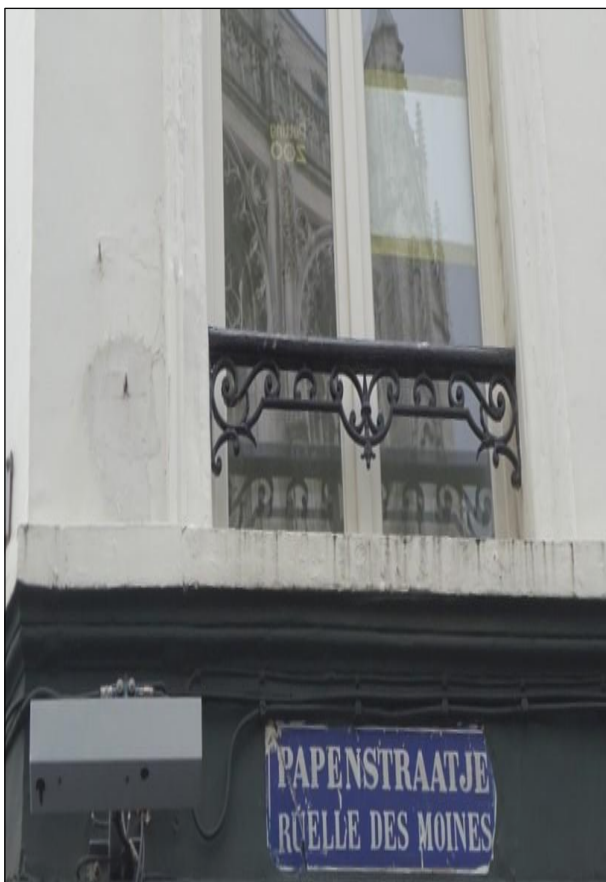
In de schaduw van de Onze-Lieve-Vrouwe kathedraal te Antwerpen

De zusters moesten de Dijlestad ontvluchten door de terreur en de repressie van de geuzen. Ze namen aanvankelijk hun toevlucht in een huurhuis in het Papestraatje te Antwerpen , gelegen tegenover de O.- L.- Vrouwekathedraal. Maar ook in de scheldestad verschenen de geuzen ten tonele. De kloosterzusters vluchtten via Bergen-op-Zoom, Roosendael, Hoogstraten, Venlo en de Rijn naar Keulen . Ze vestigden zich daar in een woonhuis dichtbij de Sint-Kunibertuskerk waar ze toen 2 gulden huishuur per maand betaalden. Priorin Margaretha van Wisschaeven overleed er op 13 september 1580 en werd begraven in de Dominikanenkerk in Keulen. De tien andere zusters kozen Elisabeth Suetens als nieuwe overste. Vlees, boter en ander proviand werden vanuit Antwerpen per schip aangevoerd door hun koerier Nicolaas Oostermans. Toen Mechelen in 1585 terug onder Spaans bewind kwam, vestigden de zusters zich terug in de Dijlestad in de residentie van de Begijnenstraat .