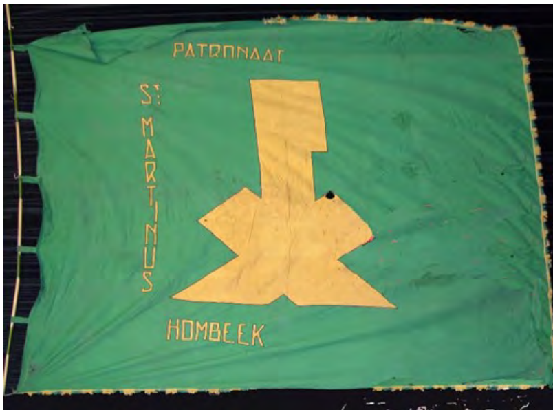
De vlag van het M.A.P., bewaard in het Hoembeka-archief.